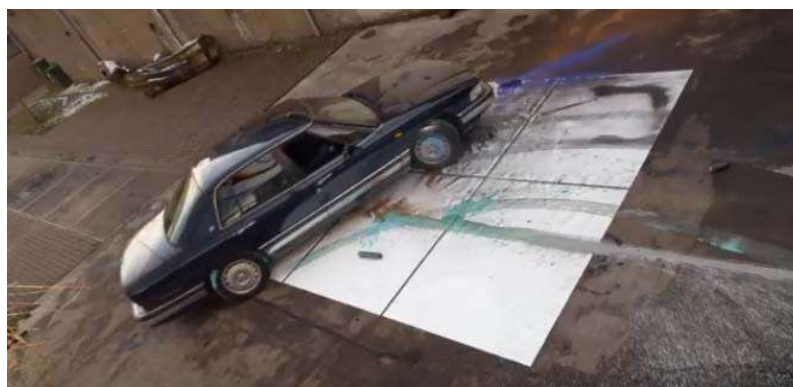
Unmovement, car painting view

Une vidéo de la création des toiles, réalisée par le collaborateur de longue date de l'artiste, Sander Lanen, est montrée dans l'exposition : le moteur de la voiture gronde, les bombes de peinture sont disloquées de manière brutale et déversent de la couleur sur les surfaces blanches, qui sont découpées et purgées comme des plaies ouvertes.