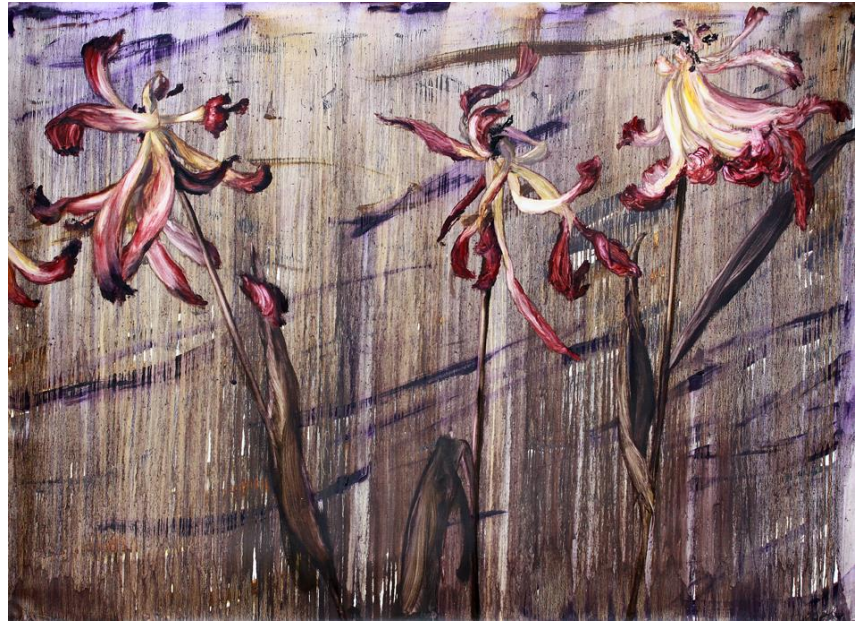
Gaël Davrinche Tulipes 2011

En septembre, les salons et foires d'art contemporain se multiplient à Shanghai. Photo Shanghai, SH contemporary autant que les grandes expositions de rentrée dans les musées attirent les collectionneurs du monde entier et en particulier de Hong Kong. Pour célébrer cette période particulièrement riche pour l'art contemporain, la galerie Magda Danysz présente l'exposition collective INSIGHT à partir du 6 septembre qui réunit des pièces majeures de ses artistes, de Gaël Davrinche à Huang Rui en passant par JR, Maleonn ou Liu Bolin.