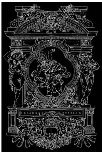
Nicolas Buffe, 2009